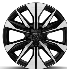
Bangkok 17 pouces Jantes en alliage à coupe diamantée