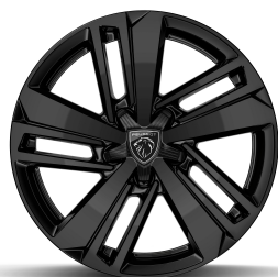
Auckland 16 pouces